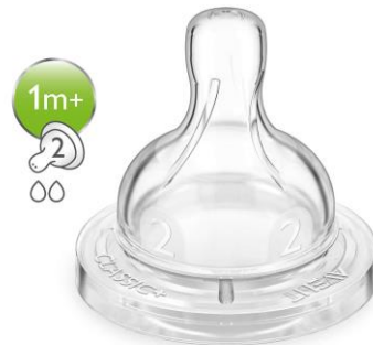
Fluxo #2 - Lento 177SCF632/27 6779629