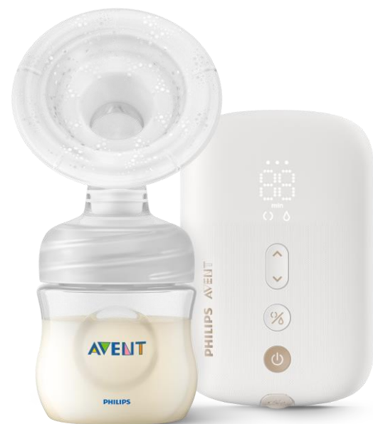
Bomba Elétrica – Com bateria 177SCF396/11 N/D