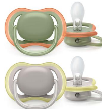
#2 unidades 177SCF085/20 7244814