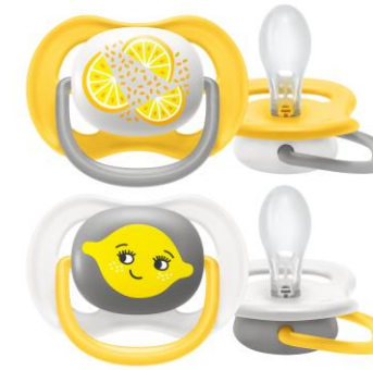
#2 unidades 177SCF080/18 7237206