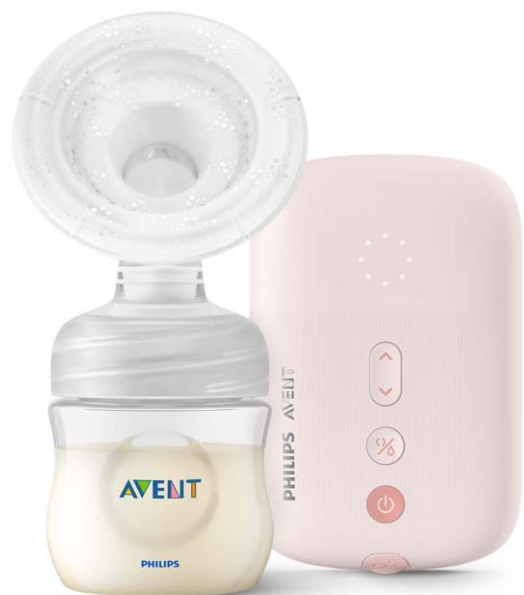
Bomba Elétrica – Sem Bateria 177SCF395/31 6621938