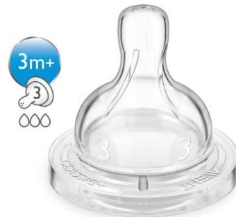
Fluxo #3 - Médio 177SCF633/27 6779652