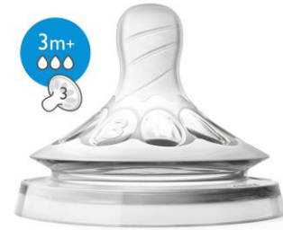
Fluxo #3 (Médio) 177SCF043/27 6926618