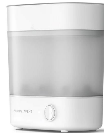
Com função de Secagem 177SCF293/00 N/D