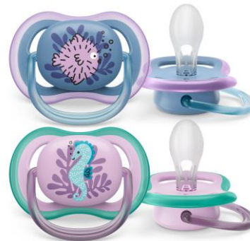
#2 unidades 177SCF085/61 7095869