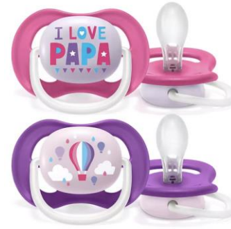
#2 unidades 177SCF080/04 7095760