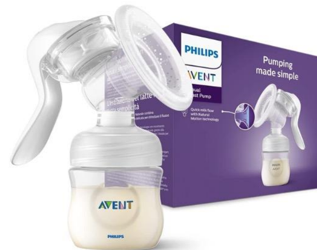
Bomba Manual Basic - Natural 177SCF430/01 7279505