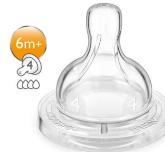
Fluxo #4 - Rápido 177SCF634/27 6736595