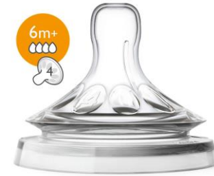
Fluxo #4 (Rápido) 177SCF044/27 6926626