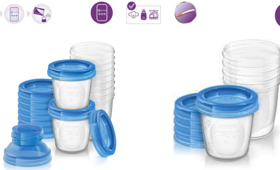
180ml – 10 unidades 177SCF618/10 6794289