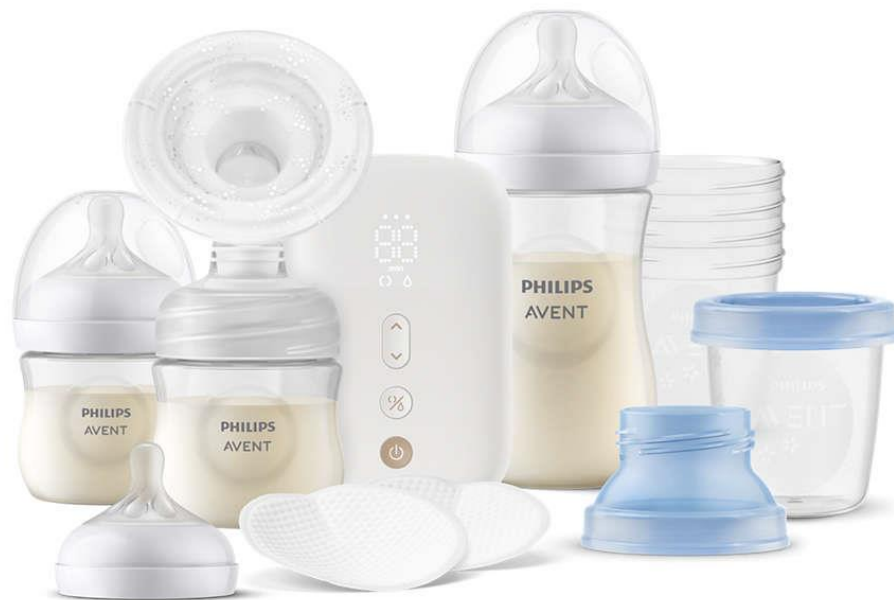
Conjunto de Amamentação - Premium 177SCD330/31 N/D