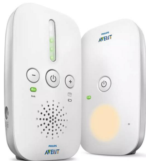
Digital 177SCD502/26 N/D