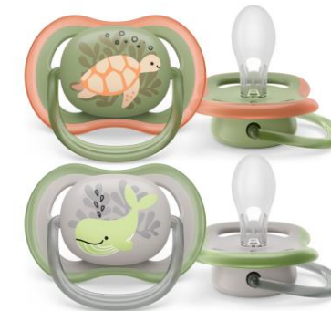
#2 unidades 177SCF085/60 7095851