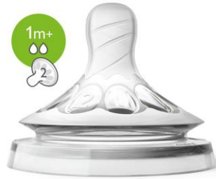
Fluxo #2 (Lento) 177SCF042/27 6926600