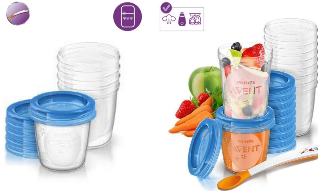
180ml – 5 Unidades 177SCF619/05 7046276 10-180ml + 10-240ml 177SCF721/20 6794305