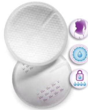
Descartáveis - 60 unidades 177SCF254/61 6063594