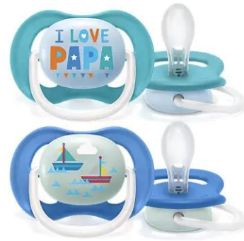
#2 unidades 177SCF080/03 7095752