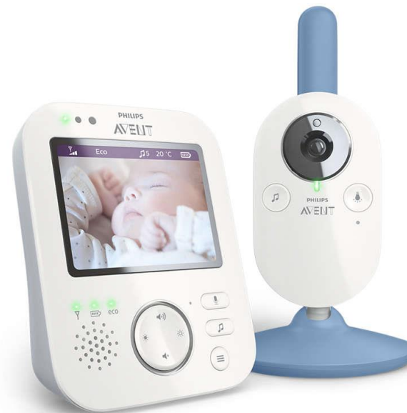
Vídeo 177SCD845/26 N/D