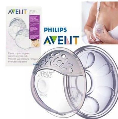
Ventiladas e Não ventiladas 177SCF157/02 6779686